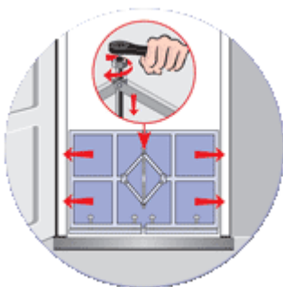
Step 1: Expansión horizontal

La barrera de puerta es un marco encuadrado en acero de 25 mm de grosor que se expande en el plano horizontal y vertical (consulte los diagramas inferiores). El marco de acero está rodeado de una funda de neopreno de 7 mm de grosor que, cuando se expande, forma un sello estanco al agua entre él y la apertura donde se expande.