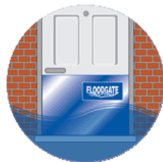
Step 3: Floodgate colocado