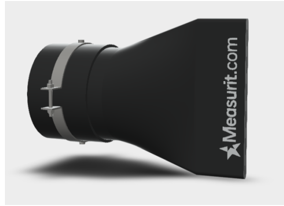
CORREDERA DIRECTA A TUBERÍA (SDP)