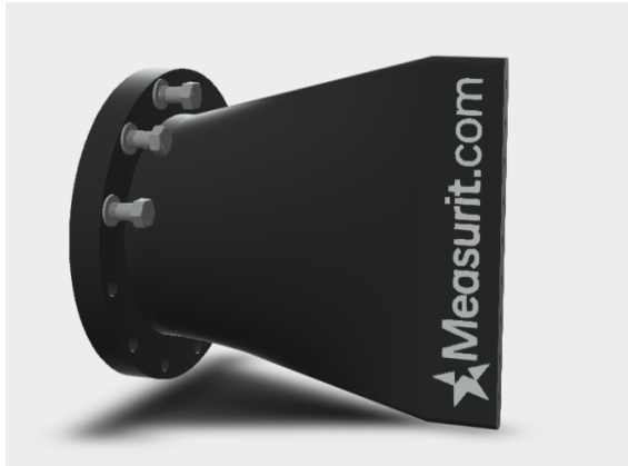
CONEXIÓN DE TUBERÍA CON BRIDA (DBF)